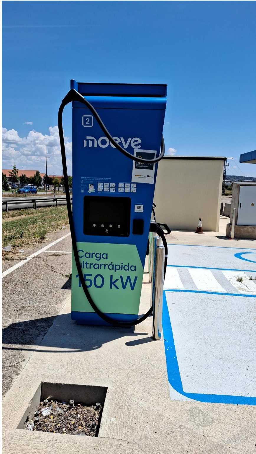
Frontal cargador 150 kW ES Caballo Blanco

A continuación, se adjuntan una serie de fotografías, tanto del punto de recarga como del cuadro de protección y resto de la instalación eléctrica: