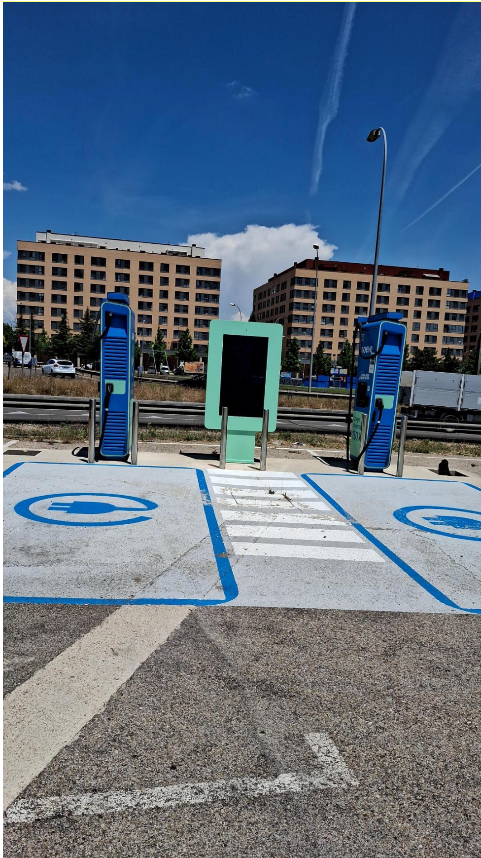
Plazas de carga ES Caballo Blanco